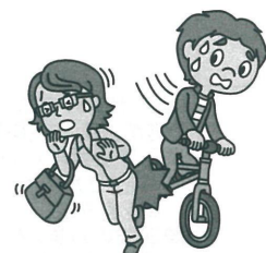
自転車で走行中、通行人にケガをさせてしまった。

※個人賠償責任については日本国内での事故(訴訟が日本国外の裁判所に提起された場合等を除きます。)に限り、示談交渉は原則として東京海上日動が行います。