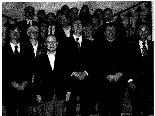
ブダペスト仏教学センター開所式