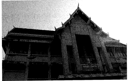
ワット・ポーの僧房エリア側の寺院図書館

今回の調査は、かなりの時間的制約があったことも含め当初予定していた4/132: Paṭipattisaṅgha (5 phūk)、4/155: Candasenajātaka (1 phūk)、Nandarājajātaka (1 phūk)、Rathasenajātaka (2 phūk)、Varavaṃsakumārajātaka (1 phūk)、Sirisāracakkavattijātaka (2 phūk) などの写本文献についての調査・写真撮影を行うことができなかった。これらの写本文献については、ワット・ポーと協力関係が築かれている現在、出来る限り早く再訪して、引き続き調査・写真撮影を実施したい。