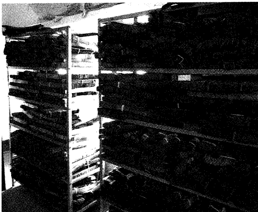
サラスヴァティー研究所所蔵のサンスクリット貝葉写本

写本研究は、現地での情報収集が最も大切である。研究所や図書館や大学などが写本を所蔵しているとしても、カタログが公開されていなければ、そのコレクションの存在を知ることはできない。さらに個人が所蔵しているコレクションは世間にはまったく知られていない。今回の研究調査では1本ずつの写本を最初から解読していくという作業は時間的制約のため不可能であった。未知の写本を発見するためにも、さらに既知の写本であってもその内容を検証するためにもじっくりと調査・研究する必要性を実感した研究調査出張であった。