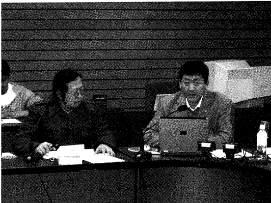
「公開研究会」講演中の扎布教授 (右側)