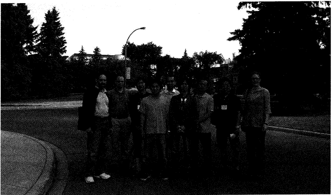
カルガリー大学キャンパスにて

今回の学会参加と現地調査は、北米における浄土真宗の研究・開教の状況と動向を把握するために、とても有意義で貴重な体験であった。