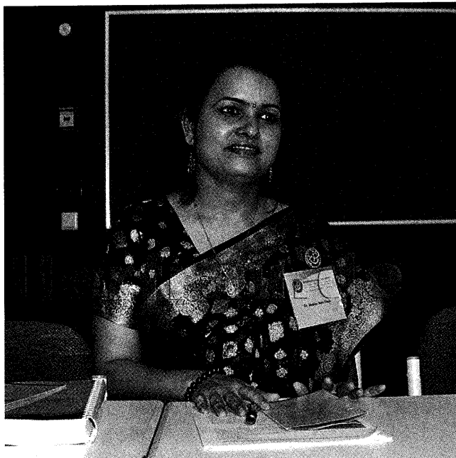
ハンブルグ大学(ドイツ)にて

当大会はチベットにおける比丘尼制度の成立に関して 画期的な大会であって、新しい歴史を生み出すに相違な い。