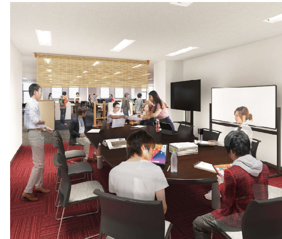
セミオープンなワークショップルーム

※その他に、ワークショップルーム1と総合研究室外の響流館3階にワークショップルーム3があります