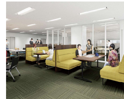
じっくり腰をすえて相談できるボックスソファ席