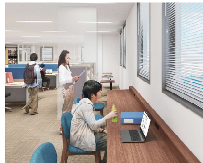
気軽に利用できるカウンター席