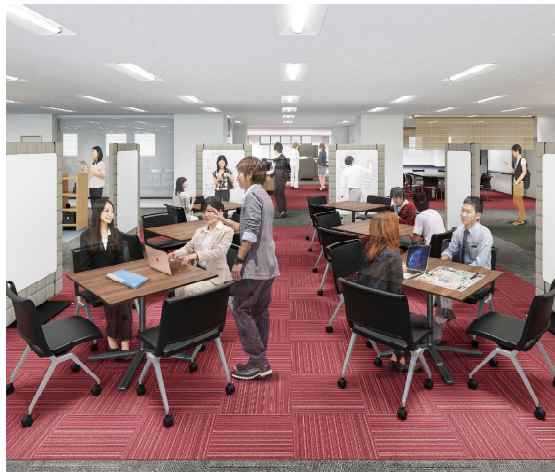
交流しやすい四角テーブルとホワイトボード