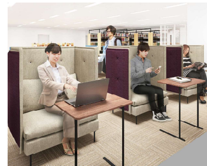
集中できる1人ソファ席