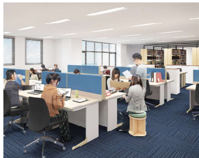
大学院生（修士課程と博士後期課程）の院生デスク