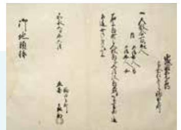
福田寺町内合計人数達