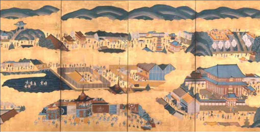
洛中洛外図屏風 [部分]