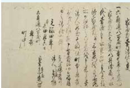
八百屋町家屋敷売請状