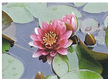
ガーデンミュージアム比叡の庭園より