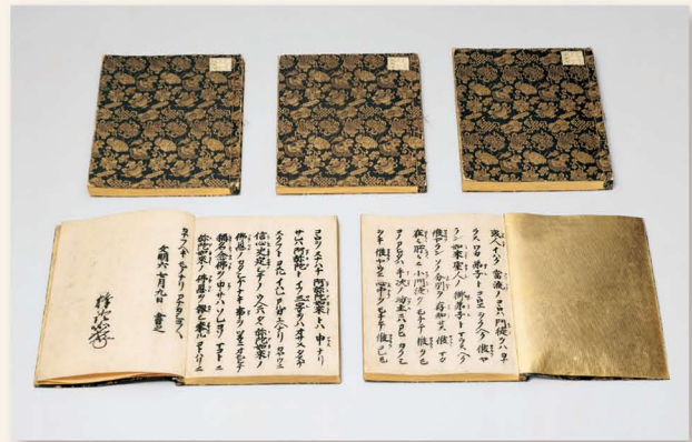
《五帖御文》 大谷大学博物館蔵