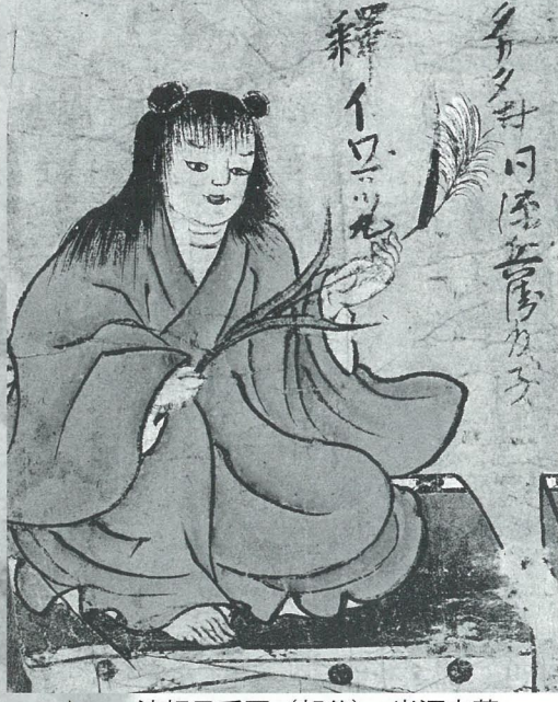
▲ 一流相承系図(部分) 光源寺蔵