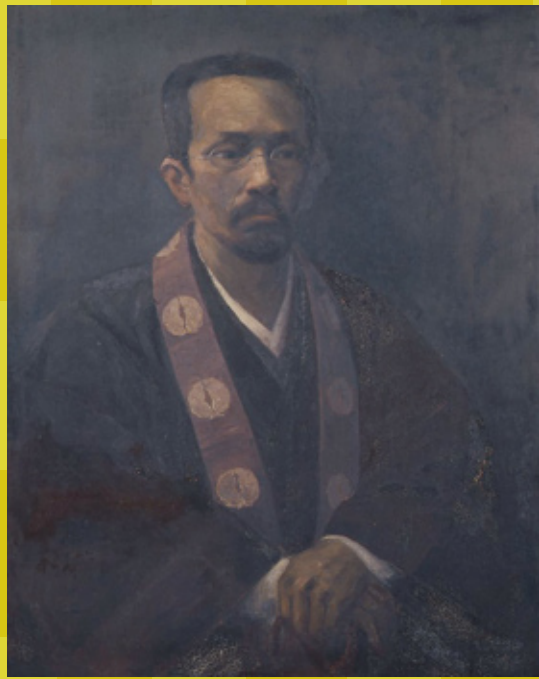
初代学長 清沢満之