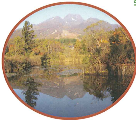
いもり池に映る妙高山 美しい自然のいとなみに感動