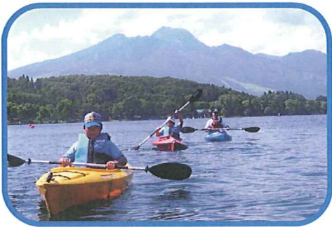
野尻湖でカヤックを漕ぐ