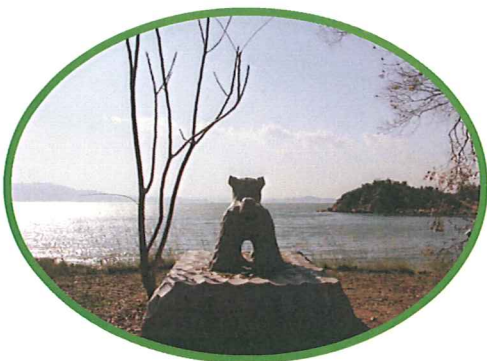
石のアートが並ぶ海岸