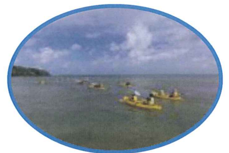
入り江でシーカヤックを漕ぎ、 手作りの竿で魚を釣る