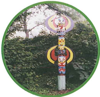
トーテムポールの創作