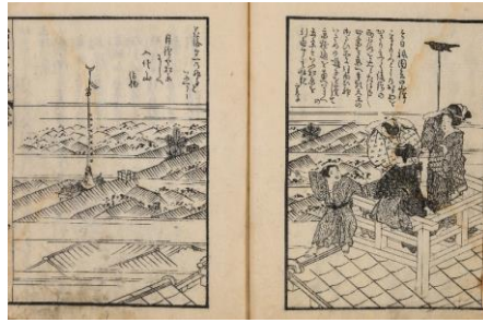
▲増補日本年中行事大全