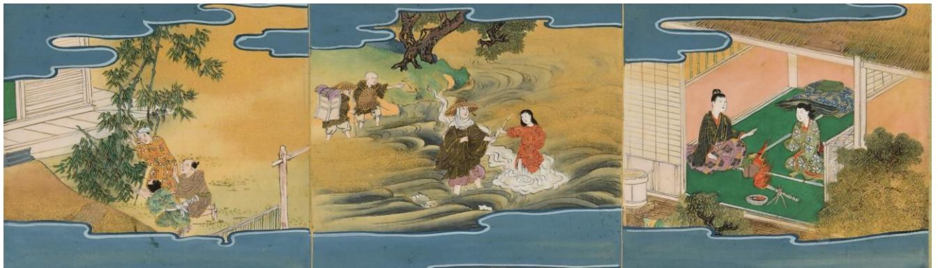
▲親鸞聖人巡拝絵図（部分）