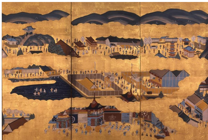
▲洛中洛外図屏風(大谷大学博物館蔵)

※内覧会出席ご希望の場合、下記メールアドレスまでご連絡をお願いいたします。【期日：8/30(水)】