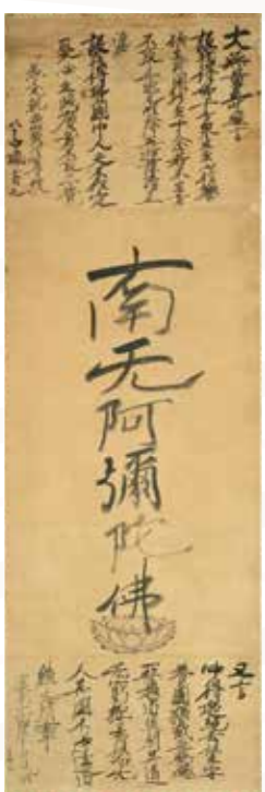
親鸞筆 鎌倉時代 康元元年(一二五六) 京都 西本願寺 (5月2日~5月14日展示)