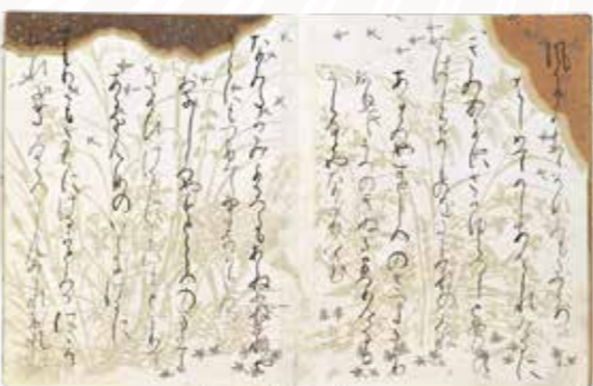
平安貴族の美意識の結晶

浄土眞宗は大きく発展を遂げ、そこには法物の他にも多数の名宝が伝来しています。ここでは京都の浄土眞宗寺院に伝わる障壁画と古筆の優品を紹介します。