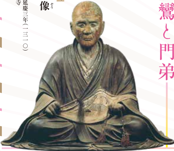
快慶作 鎌倉時代 延慶三年(一二三〇) 栃木 専修寺 (通期展示)