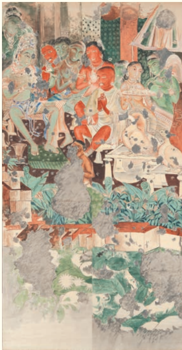
アジャンター壁画模写（ハンサ・ジャータカ）