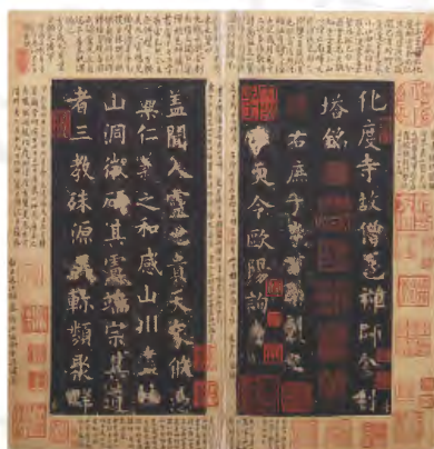
重要文化財 宋拓「化度寺故僧邕禅师舍利塔銘」 紙本墨拓 唐時代（貞観五年=631：原碑亡佚）

この二つの作品は、中国の隋・唐時代に流行した仏教の一派である三階教の開祖信行禅师（五四〇～五九四）と、その布教に尽力した弟子僧邕禅师（五四三～六三二）の功績を記したものです。両碑の原石は早くに亡失してしまつたため、三階教を知る上できわめて重要な資料です。さらに原碑の筆者は、中国の四大書家に数えられる欧陽詢（五五七～六四二）と薛稷（六四九～七二三）の二人で、彼らの筆跡を今に伝える数少ない資料としても知られています。