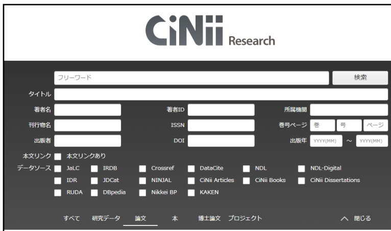
《図-2 CiNii Research 詳細検索画面》