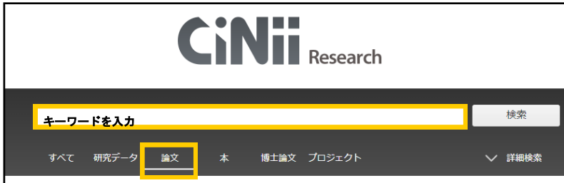
《図-1 CiNii Research トップ画面》

[論文]タブを選択して、画面中央の入力欄にキーワード(※1)を入力し[検索]をクリックします。