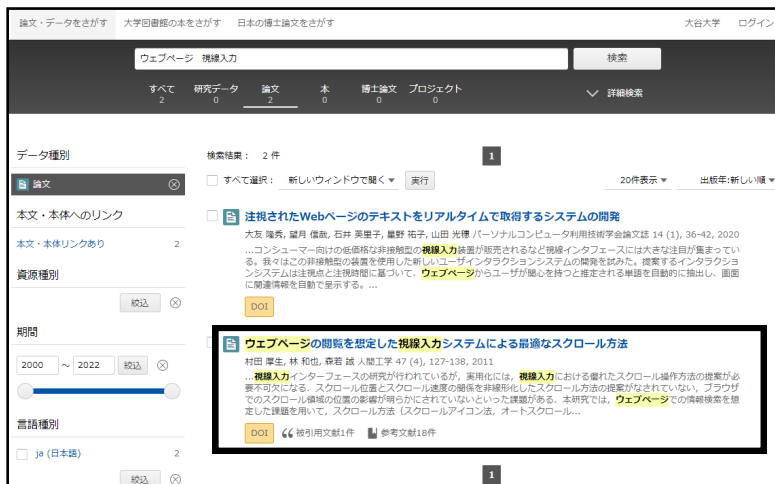
《図-3 CiNii Research 検索結果一覧画面》