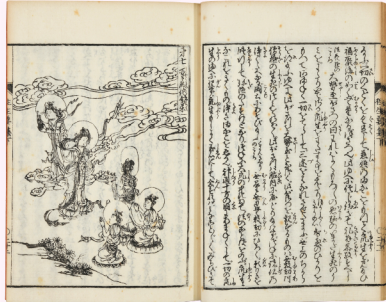
右・下:往生要集 卷下 大谷大学図書館蔵 左上:宇治拾遺物語(部分) 大谷大学図書館蔵