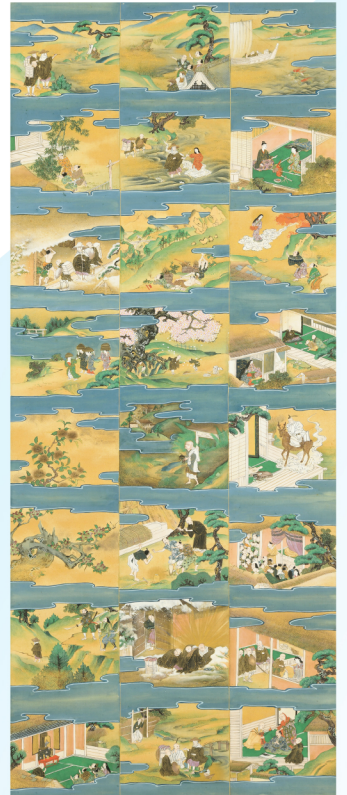
上:親鸞聖人巡拝絵図 大谷大学博物館蔵 左:捨遺古徳伝絵 常福寺本模写 大谷大学図書館蔵 下:二十四輩順拝図会 上之第五(部分) 大谷大学図書館蔵