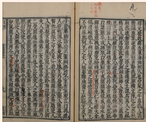
『末高僧伝』巻第四(部分)