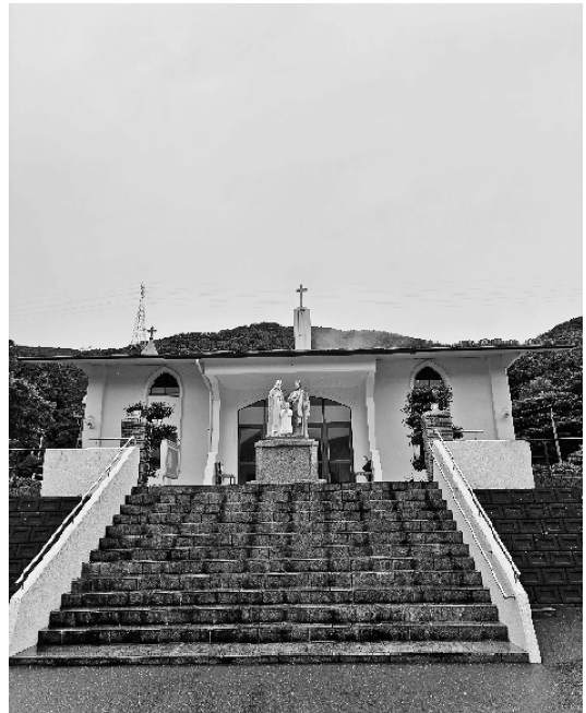
2025.9.2 カトリック鯛ノ浦教会