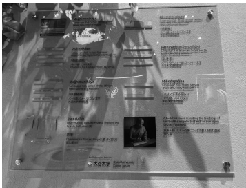
複数の文字での仏教伝播を表現するため大谷大学博物館が所蔵する写本を展示