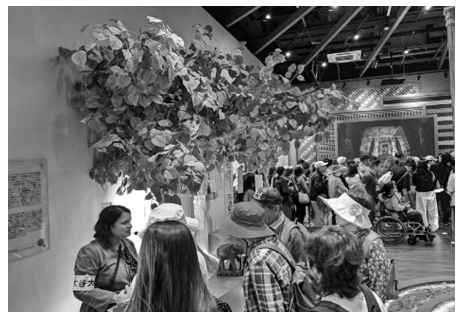
ダシュ教授による菩提樹展示の説明(2枚)