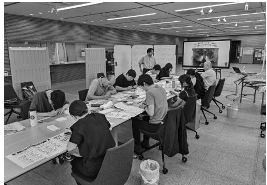
写本を作成する参加者の様子

写本作成のワークショップでは、ブッダの言葉に触れながら、実際のヤシの葉と鉄筆を用いて、参加者が自分だけの写本を作成しました。