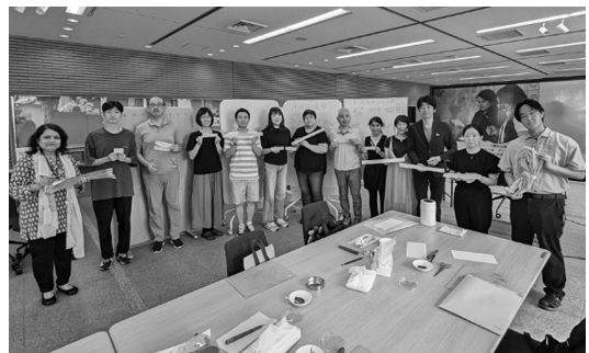
完成した写本を手に持って記念撮影

なお今回仏教写本研究が協力した大阪・関西万博インド館には期間中に3,730,096人の来場者があり、多くの方々に本学の研究の一端に触れていただくことができました。