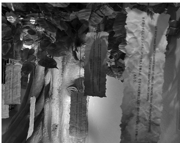
ブツダの金言に触れる展示 (複数の文字を使用したパーリ語表記・日本語表記・英語表記)