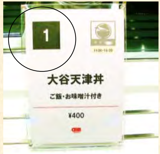
<受取りカウンター>