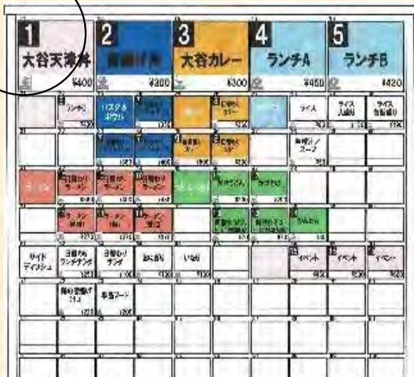
<券売機レイアウト>