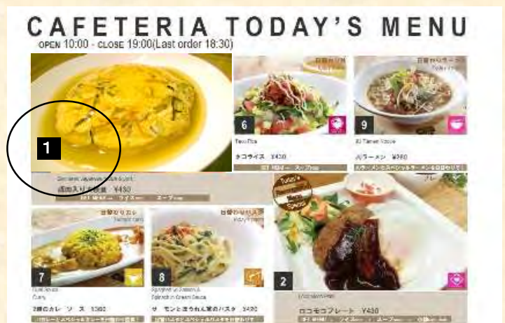
<メニューモニター>