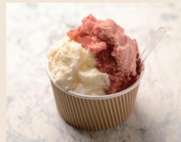
※写真は通常サイズ