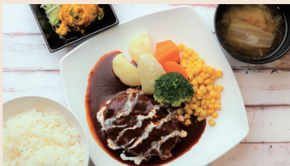
学食メニューイメージ