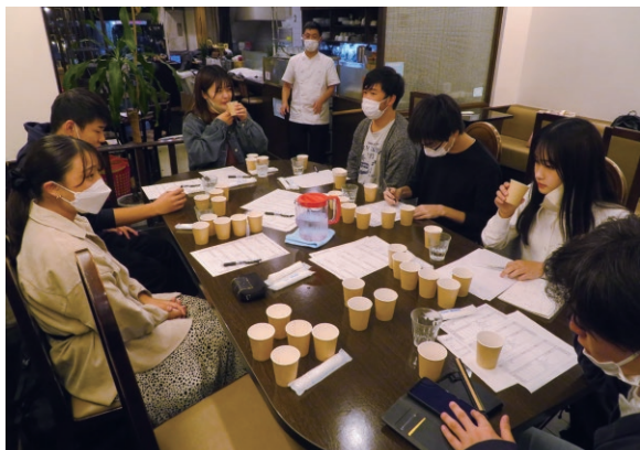
※コーヒー制作中の様子

大谷大学学生会が、北大路商店街の伊藤珈琲さんのご協力のもと、大学オリジナルコーヒーを現在制作中です。試作品2種類をぜひ試飲のうえ、ご意見をお聞かせください(先着順で記念品をプレゼント)。あなたのご意見がコーヒーの味に反映されるかも!?