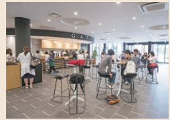
[1F] 学生ロビー内カフェ

スタイリッシュな外観の慶間館は、2018年に竣工した新しい教室棟です。 1Fの学生ロビーやカフェを中心に、教室だけでなく各種学習支援施設や多彩なマルチスペースが配置され、学生の学びをサポートします。