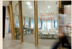
[1F] GLOBAL SQUARE (語学学習支援室)