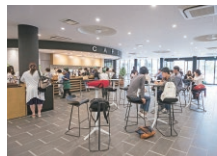
[1F] 学生ロビー内カフェ

1Fの学生ロビーやカフェを中心に、教室だけでなく各種学習支援施設や多彩なマルチスペースが配置され、学生の学びをサポートします。