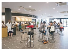
[1F] 学生ロビー内カフェ

スタイリッシュな外観の慶間館は、2018年に竣工した新しい教室棟です。 1Fの学生ロビーやカフェを中心に、教室だけでなく各種学習支援施設や多彩なマルチスペースが配置され、学生の学びをサポートします。