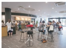
[1F] 学生ロビー内カフェ

1Fの学生ロビーやカフェを中心に、教室だけでなく各種学習支援施設や多彩なマルチスペースが配置され、あなたの学びをサポートします。