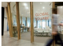
[1F] GLOBAL SQUARE (語学学習支援室)

総合研究室[3F]、図書館[1F~2F]に 実際に入らせていただくことが可能です！