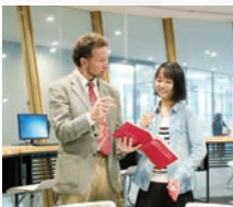
(1F)GLOBAL SQUARE (語学学習支援室)