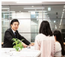
(1F)キャリアセンター