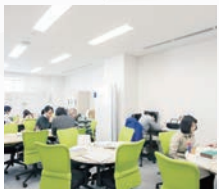
(1F)LEARNING SQUARE (学習支援室)