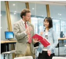
(1F)GLOBAL SQUARE (語学学習支援室)