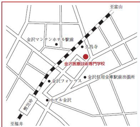
金沢試験場 (金沢医療技術専門学校)