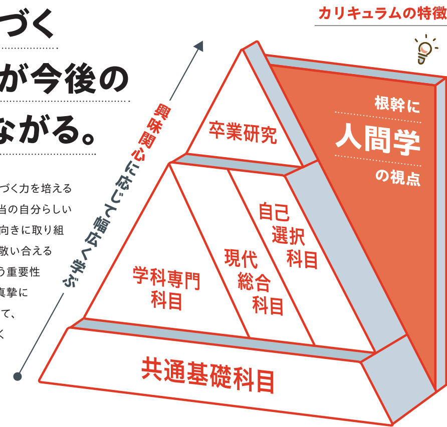
カリキュラムの特徴

大谷大学のカリキュラムは、三モットーに基づく力を培えるように設定されています。「本務遂行」は本当の自分らしい生き方を問い続け、答えのない課題にも前向きに取り組む力。「相互敬愛」は、多様性の中で他者と敬い合える力。「人格純真」は自分を理解し、他者を敬う重要性を理解したうえで、社会変化や社会課題と真摯に向き合う力です。そしてカリキュラムにおいて、すべての根幹となり、専門分野だけでなくキャリア教育にもつながる大谷大学ならではの学びが「人間学」です。