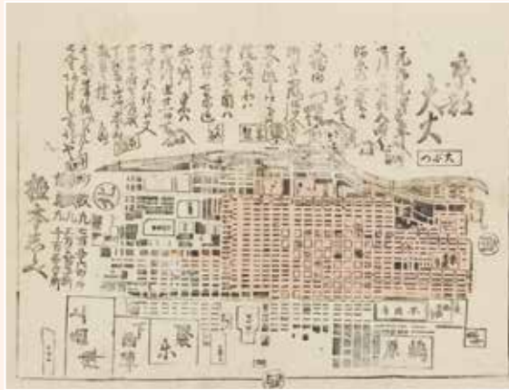
《元治元年京都大火図》