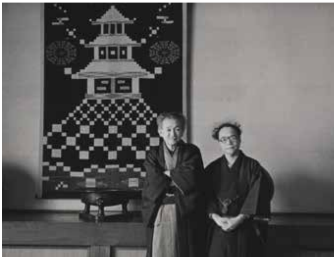
日本民藝館展示室にて 柳宗悦、棟方志功(1954年頃)

暮らしのなかの実用品に「用の美」を発見し、それらの生活道具を民藝（民衆的工芸）と名づけたのは、思想家の柳宗悦（一八八九〜一九六一）でした。柳はみずから「直観」によって、国内外の民藝作品を数多く蒐集するとともに民藝運動を展開しました。そして、その柳に才能を見出され、生涯柳を師と慕ったのが板画家の棟方志功（一九〇三〜一九七五）でした。二人はともに戦中・戦後に真宗王国越中富山の人びとの生活に息づく信仰風土「土徳」と出会い、大きな影響を受けました。柳は「仏教美学」という思想を確立し、棟方も自分ではない「他力」による創作活動に取り組みようになつたのです。 本展覧会では、柳・棟方に影響を与えた越中真宗の信仰風土「土徳」について二人の著作や作品とともに紹介いたします。