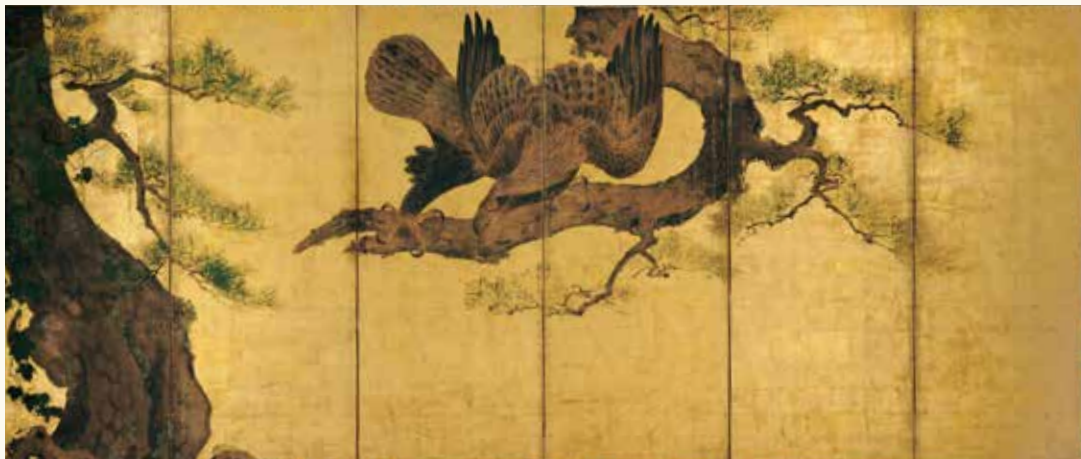
松鸞猿画金屏風 高山別院照蓮寺(高山市)

The Shin Buddhist Tradition in Hida: The 430th Anniversary of the Transfer of Shōrenji to Takayama