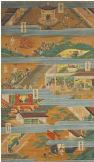
親鸞聖人絵伝 第四幅 高山別院照蓮寺(高山市)