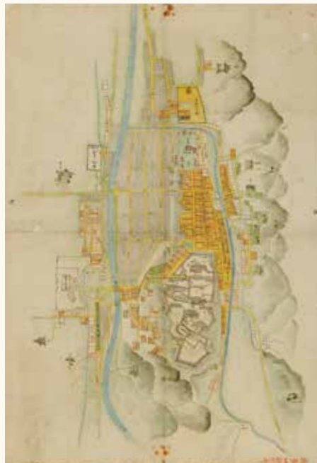
高山城下町絵図 了徳寺(高山市)