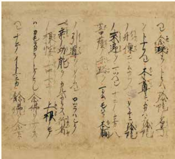
親鸞聖人筆 唯信鈔(断簡) [部分] 高山別院照蓮寺(高山市)