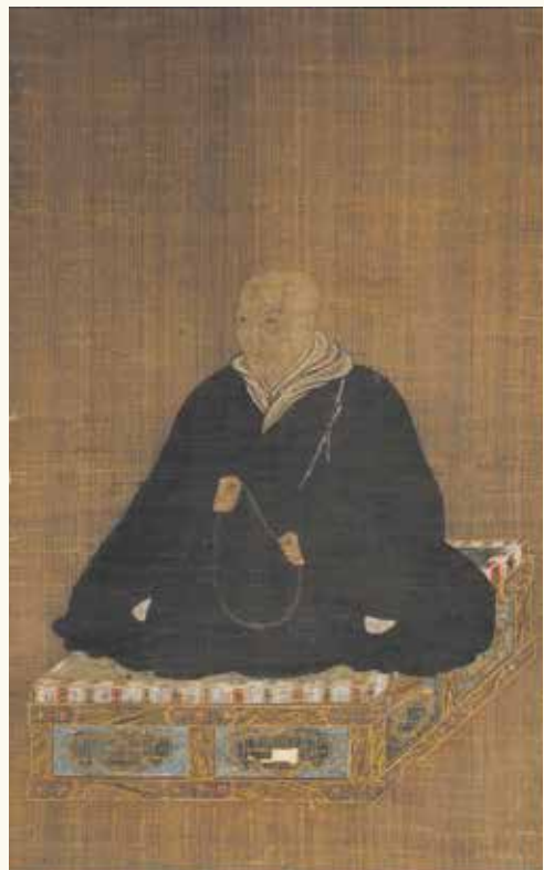
親鸞聖人御影 照蓮寺(高山市)