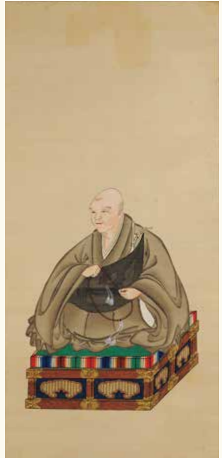
嘉念坊善俊画像 高山別院照蓮寺(高山市)

本展覧会では、中部山村地域において脈々と受け継がれてきた念仏の伝流を、高山別院照蓮寺をはじめとするゆかりの寺院の法宝物から感じ取っていただければと思います。