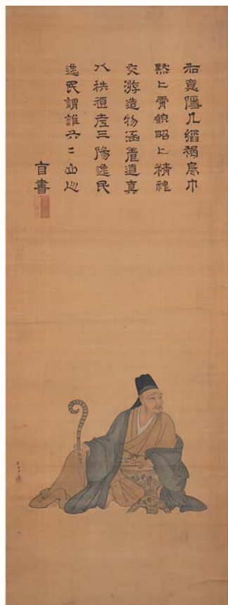
「石川丈山像」詩仙堂丈山寺