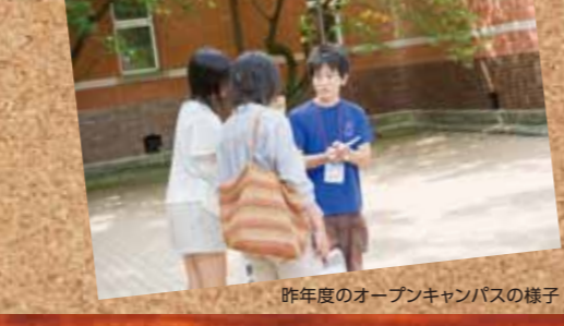
昨年度のオープンキャンパスの様子