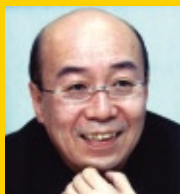
鷺田 清一氏 哲学者