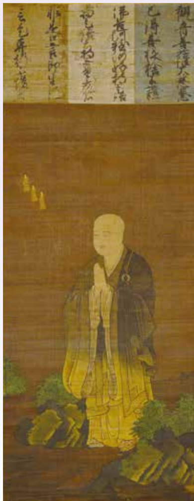
二祖対面図(善導大師像)