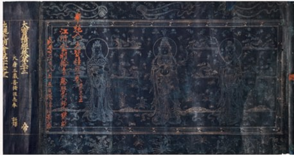
重文『大宝積経』 卷三十二 京都国立博物館蔵