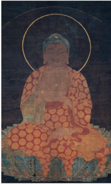
重文 阿弥陀如来図 禅林寺蔵