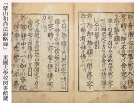
『蒙山和尚法語略録』 東國大學校図書館蔵