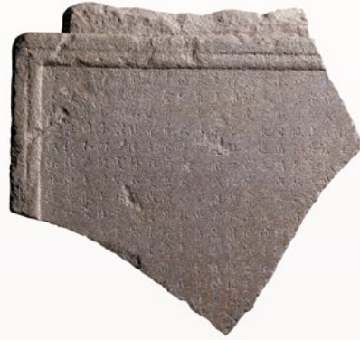
誓幢和尚碑 断片 東國大學校博物館蔵