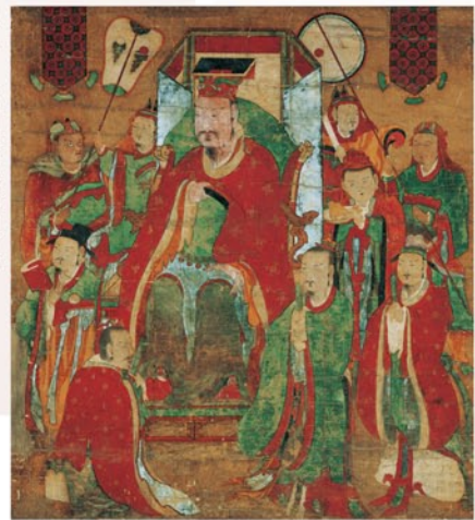
現王図 東國大學校博物館蔵