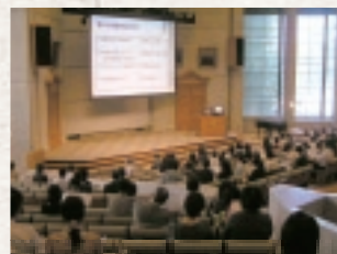
全国父母兄姉懇談会全体会の様子

7月には東京都と秋田市において、「関東地区並びに東北地区父母兄姉懇談会」が開催され、12月には静岡市と名古屋市において、「東海地区父母兄姉懇談会」が開催されました。