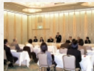
東海地区父母兄姉懇談会の様子